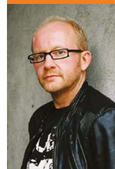
Dieter Falk Komponist

Im Laufe seiner Karriere erhielt er 79 Goldene- und Platin-Schallplatten. 2005 gewann er den Echo für sein Lebenswerk - die höchste Ehre, die Deutschlands Musikbranche zu vergeben hat.